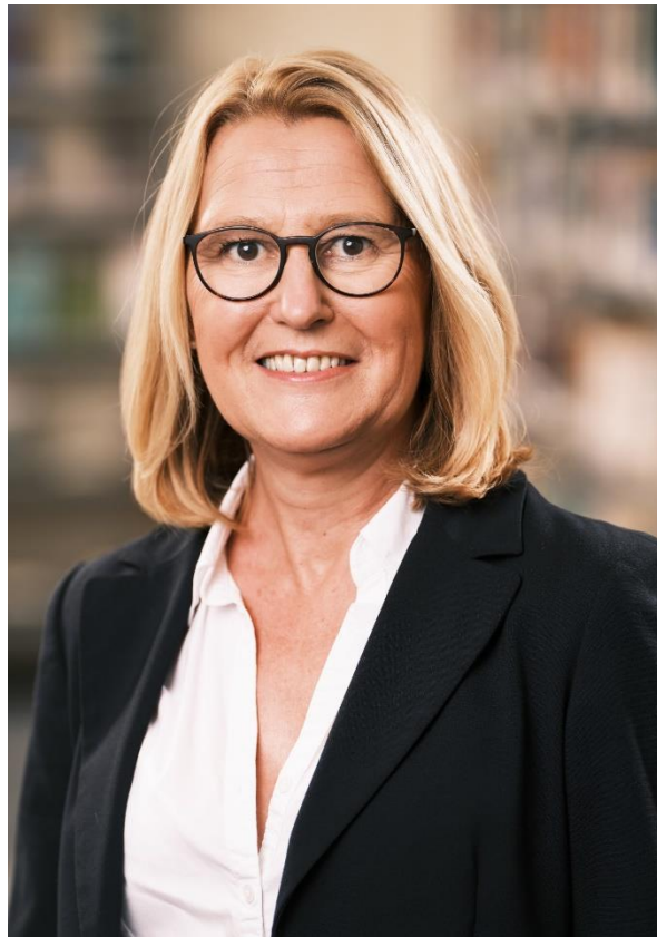
Geschäftsführerin der Stadtbibliothek Gütersloh